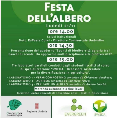
"AgriBox Lab" etkinliğinin posterini.

21/11/2022 tarihinde İtalya'da düzenlenen ve SEMPREVERD araç kutusunun tasarımına odaklanan bir dizi nitel sorgulamadan oluşan çalıştay. Bu deneyim, genel araçların, faydalı araçların ve pratik bir bakış açısıyla, hedef gruba sunulacak ana unsur olan AgriBox'ı zenginleştirecek erişilebilir bir bahçecilik kılavuzunun görsel tasarımının tanımlanmasını ve değerlendirilmesini mümkün kılmıştır. Ayrıca "Festa dell'Albero", projenin gelecekteki uygulamalarına dahil edilen "Solucan Gübresi" faaliyetinin ilk testine ev sahipliği yapmıştır.