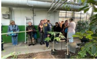
Sepreverdi Araştırma Grubu

Etkinliğin başlığı "Peyzaj ve Tarım Odaklı Sürdürülebilir Kalkınma için Eğitim" olup, eğitim ve toplumun bütünü için SKA temelli faaliyetlerin teşvik edilmesine ilişkin bir tartışmadan oluşmuştur.